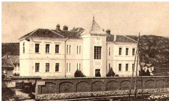
Bolnica Pirot - nekad

Period razvoja zdravstvene službe između dva rata karakteriše popunjavanje svih regiona Srbije, pa i našeg zdravstvenim radnicima, naročito posle otvaranja Medicinskog fakulteta u Beogradu. Nakon oslobođenja, oktobra 1945. god, formira se Okružna Pirotka bolnica sa 60 postelja za hirurško, ginekološko, interno i zarazno odeljenje.