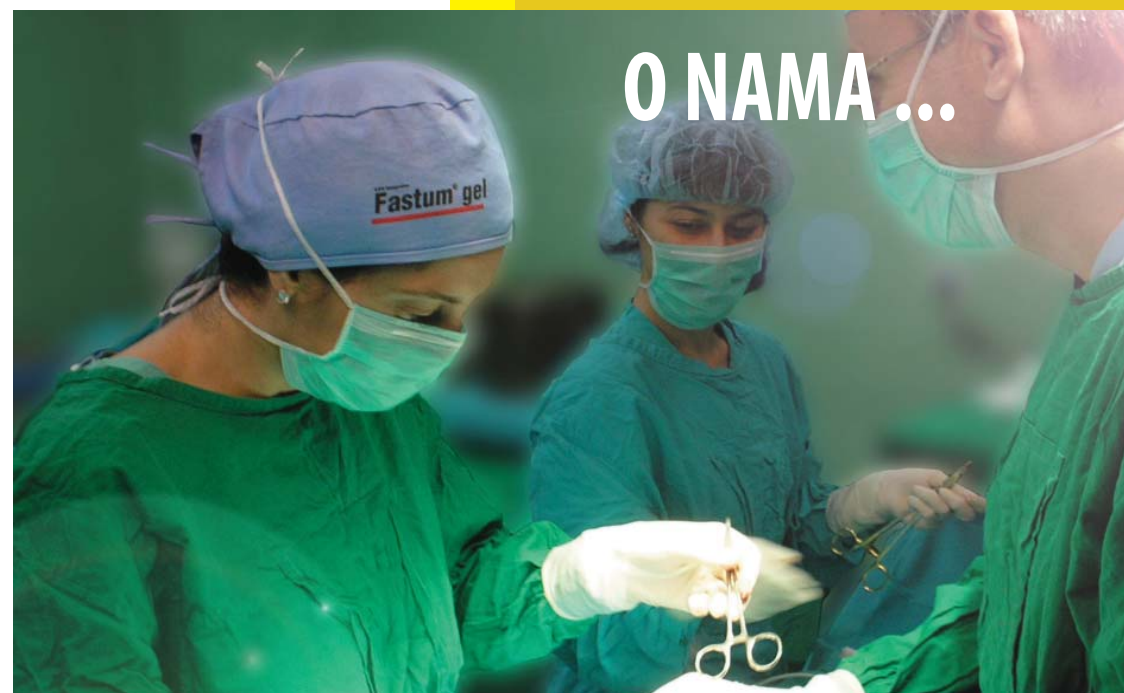
Hirurška sekcija SLD-a