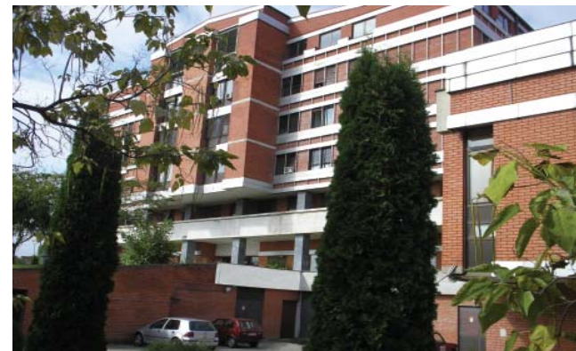
Bolnica Pirot - danas

Naša stalna orijentacija je podizanje kvaliteta i proširenje obima rada, uvođenje novih metoda i njihova komercijalizacija, usavršavanje i subspecializacija kadrova, nadgradnja imidža u svim oblastima, usaglašavanje sa globalnom strategijom zdravstvenog menadžmenta.