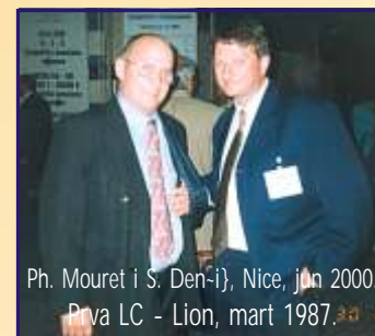
Ph. Mouret i S. Den-i, Nice, jun 2000. Prva LC - Lion, mart 1987.