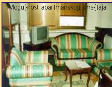
Mogu}nost apartmanskog sme{taja