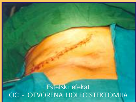
Estetski efekat OC - OTVORENA HOLECISTEKTOMIJA