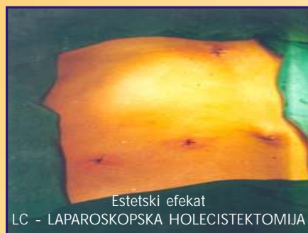
Estetski efekat LC - LAPAROSKOPSKA HOLECISTEKTOMIJA

■ Najsavremenije vanstandardne i visokospecijalizovane standardne operative procedure za tretman: